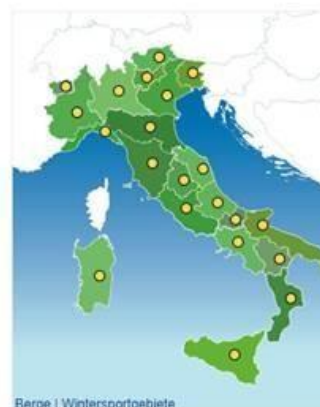
Berge | Wintersportgebiete