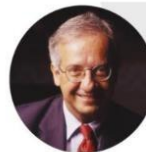
Montag 04.11 um 19:30

Interview mit Walter Veltroni , ex Bürgermeister von Rom, Schriftsteller und Regisseur des Filmes „C'è Tempo“.