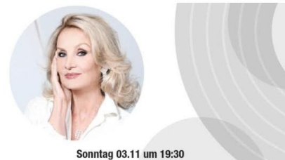
Sonntag 03.11 um 19:30

Istituto Italiano di Cultura Dante Alighieri